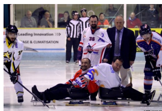
Coup d'envoi du match